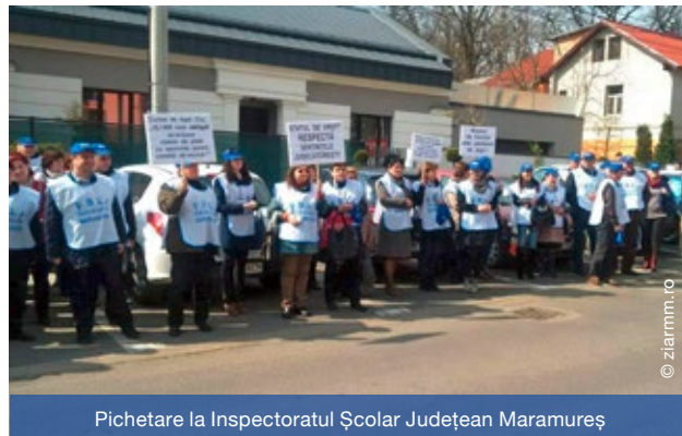
Pichetare la Inspectoratul Școlar Județean Maramureș

PRACTICA Guvernului și ale instituțiilor ce-l reprezintă în teritoriul de a nu aplica hotărâri judecătorești se confirmă încă o dată în Maramureș. Inspectoratul Școlar Județean Maramureș refuză să avizeze statele de personal și de plată care cuprind sume reprezentând sporul pentru condiții periculoase și vătămătoare, în baza legislației în vigoare, confirmată și de instanțele judecătorești prin hotărârile pronunțate pe această speță.