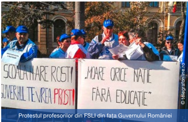
Protestul profesorilor din FSLI din fața Guvernului României

FEDERAȚIA Sindicatelor Libere din Învățământ a pichetat, în zilele de 18 și 19 aprilie 2016, sediul Guvernului României protestând față de tergiversarea legiferării Legii salarizării personalului plătit din fonduri publice.